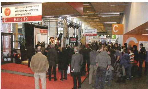
Dichtes Gedränge vor der Bühne herrschte stets bei den verschiedenen Programmpunkten des Installateurkalender-Lehrlingswettbewerbes.

Weitere Informationen unter www.installateurkalender.com .