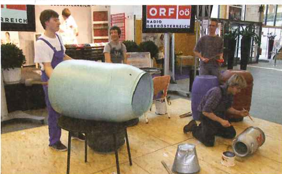
Sie waren nicht zu überhören: Die Crazy Trash Drummers.