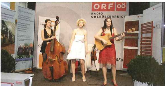
Die Dornrosen präsentierten live den Energiesparsong „Lass die Sonne ran“.