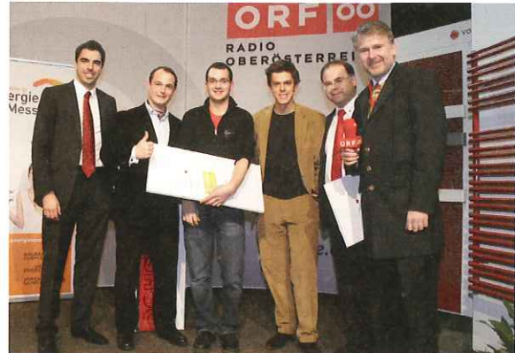
Die Gewinner-Lehrlinge wurden mit Konzertkarten für tolle Pop-Events belohnt!